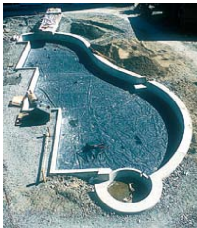
Denna dagvattendamm har en gjuten sarg i betong som gummiduken ansluts emot.

I våra egna odlingar producerar vi vatten- och strandvegetation för alla tänkbara användningsområden.