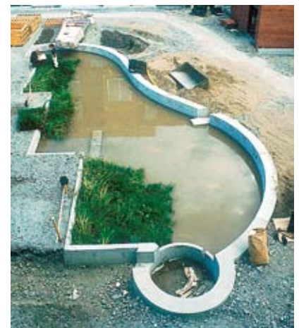
Strandmattor med färdigetablerad vattenvegetation läggs ut i dammen.