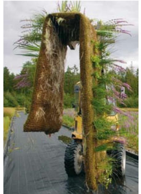
DÅVA Umeå före och efter dammbyggnad med bl a Veg Techs strandmatta.