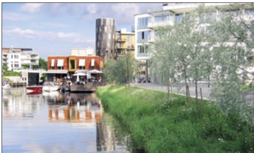
Slänt som erosionsskyddats med en meter breda Strandmattor närmast vattnet och mattor av Färdig Ång överst i slänten.

Erosionsproblem kan uppstå i flera olika miljöer och av olika anledningar. Det kan exempelvis röra sig om havs- och sjöstränder som eroderas av vågor, älv- och åstränder som påverkas av strömmande vatten samt olika typer av jordar som eroderas av vind eller nederbörd. I många fall är erosion en naturlig process där naturens krafter försöker jämna ut hinder eller motstånd i dess väg. Vissa erosionsproblem är också direkt skapade av människan som exempelvis vågerosion från båttrafik eller att konstgjorda vattendrag och slänter inte utformats på ett erosionssäkert sätt.