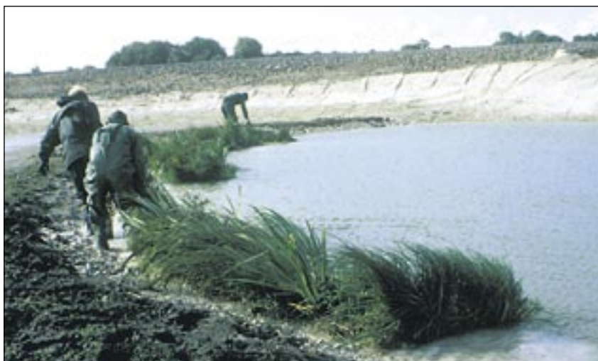
Strandmatta bogseras på plats. 1x5 meter stark armering av kokosfiber etablerad med välutvecklad vattenvegetation.

Olika typer av vatten-, strand- och markvegetation är mycket effektiv på att begränsa effekterna av de eroderande krafterna. Växternas rotsystem armerar effektivt finmaterialet i underlaget. Beroende på erosionsbelastningen kombineras växterna med armeringssystem av exempelvis organisk fiber, syntetiska nät eller olika former av stengabioner. Med växtbaserade erosionsskyddssystem ges ett skydd som dessutom är mer estetiskt tilltalande än äldre system baserade på exempelvis stenkross eller betong.