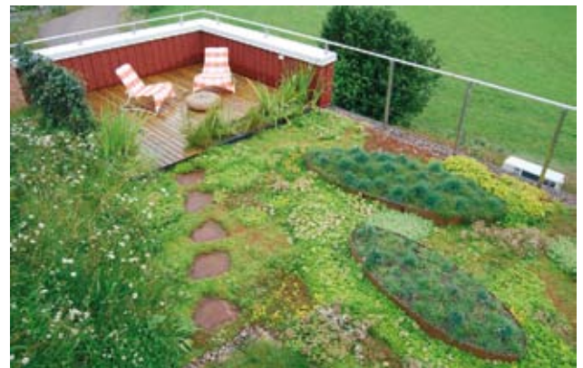
Sommaräng och fetbladsväxter på kontorets tak.