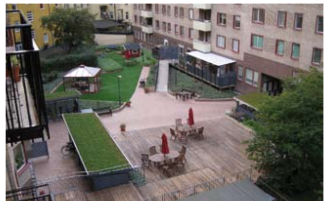
Innergård byggd med Veg Techs system. I förgrunden syns Veg Techs moss-sedumtak.

En tilltalande grön och levande miljö på gården är mycket värdefull för fastigheten. Speciellt i hårda stadsmiljöer värderas en lummig gård högt av de boende. En grön investering lönar sig oavsett om det gäller renovering av en befintlig fastighet eller vid nyproduktion. I våra tätbebyggda städer ställs allt högre krav på att man utnyttjar exempelvis takytor och överbyggda garage för att anlägga gröna ytor.