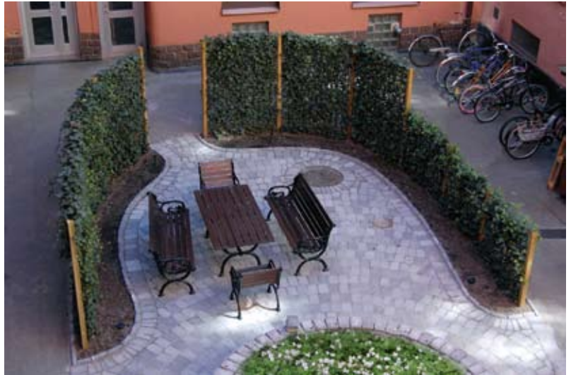
Förtillverkade växtskärmar ger direkt en grön inramning.

Att anlägga växtlighet på exempelvis ett gårdsbjälklag eller en terrass kräver stor kunskap om både växtteknik och byggnadsteknik. Veg Tech har enkla, säkra system som löser dessa problem.