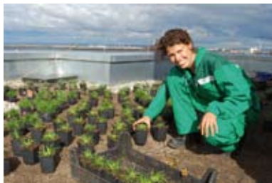
Plantering av växter på takterrass utförs av Veg Techs personal.

” Visst går det att skapa gröna och levande miljöer på sterila gårdar!