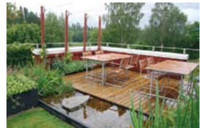
Terrass för avkoppling och en minidamm med kräftor.