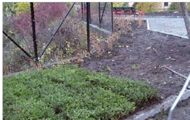
Montering av buskmatta utanför förskola.

Buskmatta basic är beställningsvara. Den kan även beställas med eget växtval.