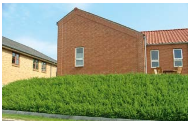
Buskmatta av lingontry i släntparti

Med buskmattornas hjälp får man omgående ett starkt vegetationsskikt som binder det underliggnade materialet. På så sätt får man en effektiv erosionssäkring av exempelvis branta slänter. Den snabba etableringen gör också att skötselbehovet blir minimalt. Direkt kan anläggningen tas i bruk. Det täta växtsättet hos buskmattorna gör att de effektivt håller önskad vegetation borta.