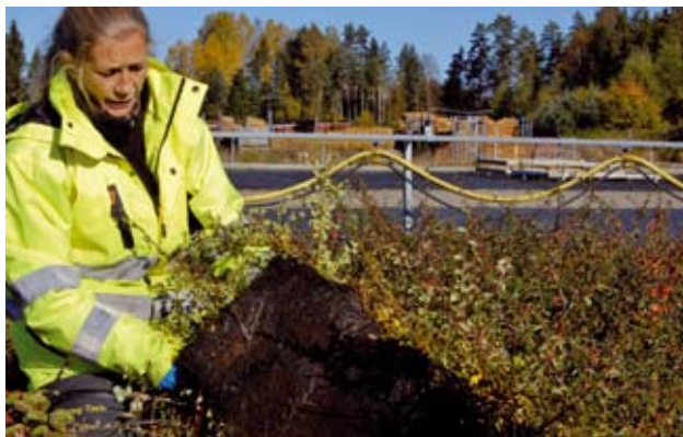
Krypoxbär är en utmärkt marktäckare