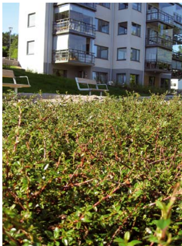
Buskmatta av krypoxbär anlagd vid nytt bostadsområde