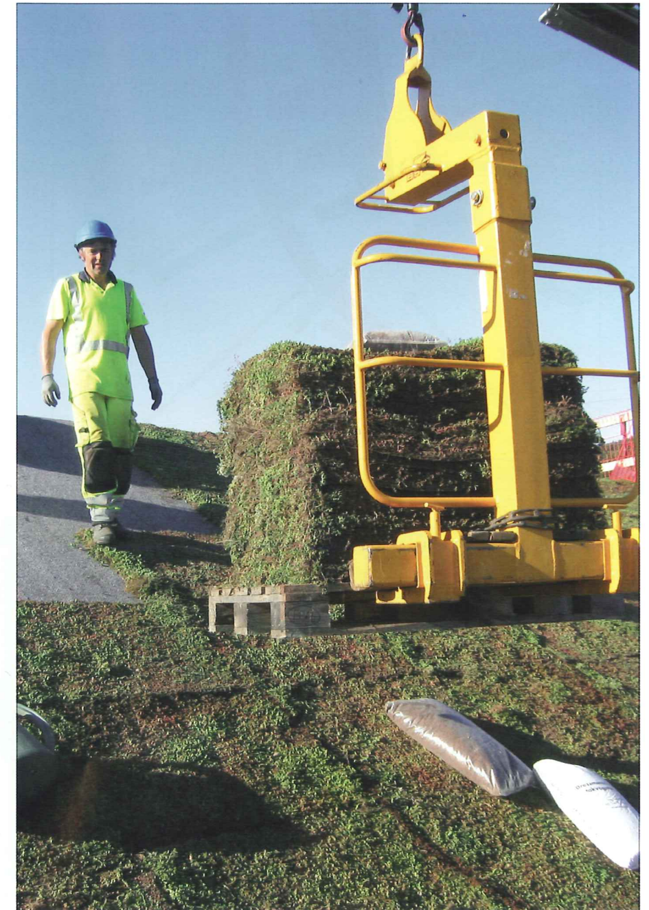
Det är ett mäktigt sedumtak, totalt 6 800 kvadratmeter. Härliga gröna tak på skolan i Romme har anlagts av Veg Tech.

– Vi har avskiltat körbanor och lekytor. Bilar kan inte köra där barn leker, säger hon.