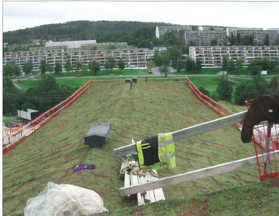
Skolans sedumtak syns från de omgivande bostadsområdena.

– Skolans utemiljö är 36,2 ha stor och har bland annat förutom lekplatser, fotbollsplan, basketbollplan, sandvolleybollbanor, löpbana, hoppgröp, bordtennis även en stor uteplats där många människor kan vistas vid olika festliga tillfällen, berättar Kari Bergo från Østengen & Bergo Landskapsarkitekter som designat utemiljön. Husarkitekter är L2 Arkitekter. Båda arkitektfirmorna har sin bas i Oslo. Skolan har formen av ett stort oregerbundet E med sneda vinklar så mycket ljus och