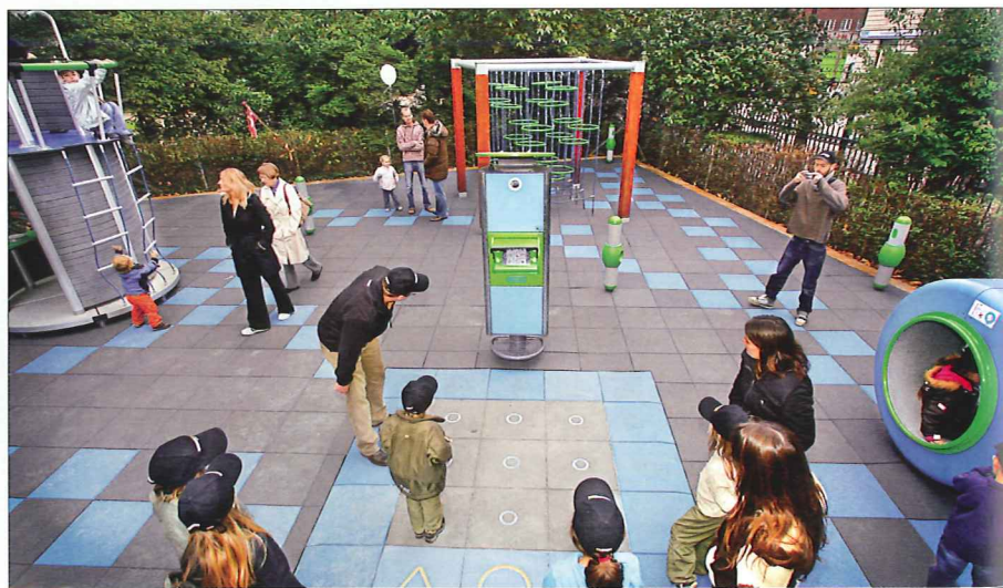
Det kallas för Smart us Playground, den dataintegrerade lekplatsen.

Tillbaka inne i klassrummet kan eleverna gå ut på Internet och se sin score och hur