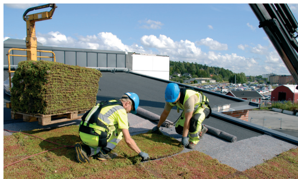
Montering på ett lutande tak med VT-filt som underlag

På ytor som inte får tillräckligt med nederbörd, t ex intill höga fasader och under takutsprång, byts vegetationen ut mot naturrunn, tvättat singel. Lägg inte singlet direkt på tätskiktet utan att det först skyddas med en fiberduk eller på det dräneringslager (Nophadrain eller VT-filt) som används under vegetationen.