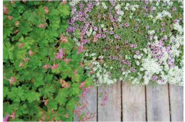
Växternas rotsystem binder ihop mattan tillsammans med en armerande stomme av kokosfiber.

Då ytan ser färdig ut från första dagen minskar risken för vandalisering av planteringen.