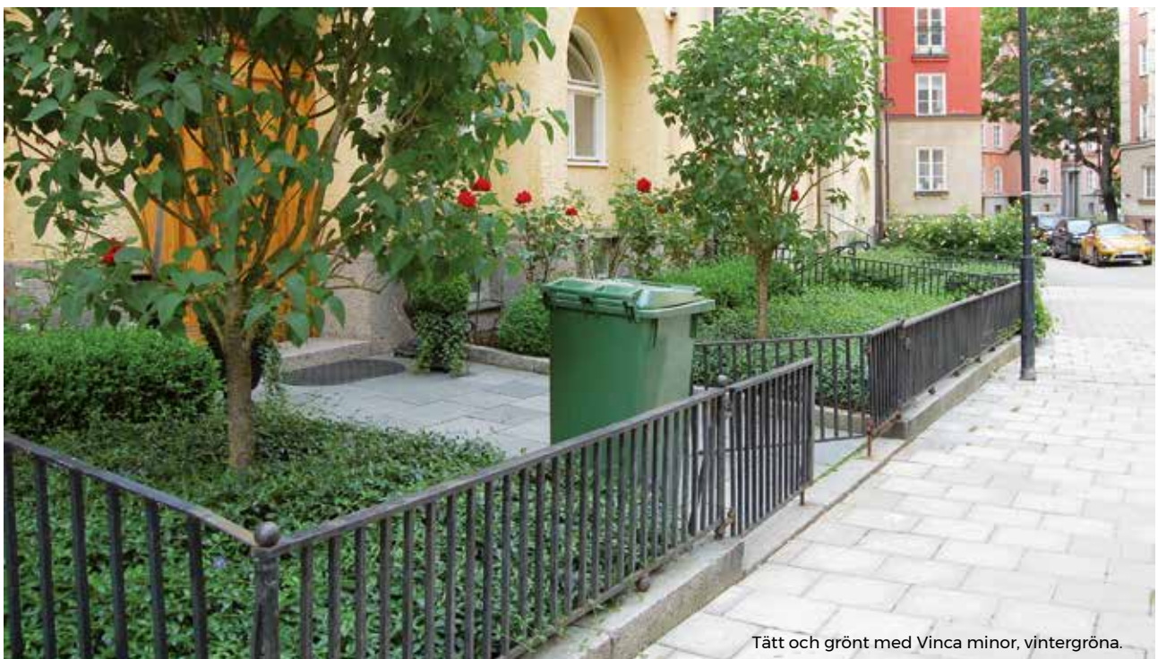
Tätt och grönt med Vinca minor, vintergröna.

Perennmattorna är lätthanterliga och etablerar sig snabbt på sin nya plats.