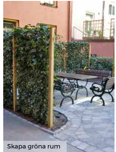
Skapa gröna rum