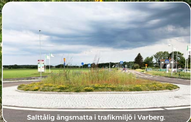
Salttålig ängsmatta i trafikmiljö i Varberg.