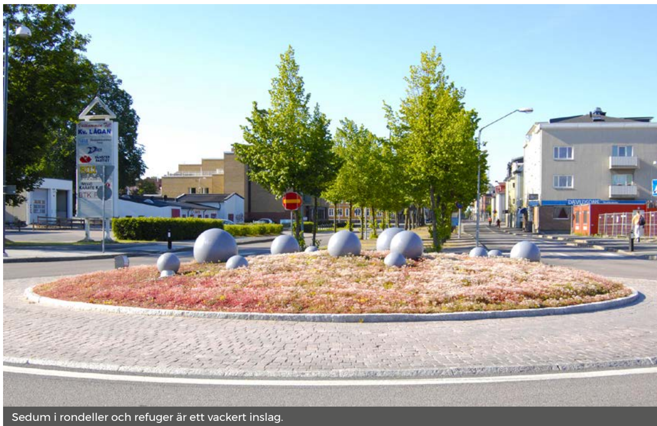
Sedum i rondeller och refuger är ett vackert inslag.