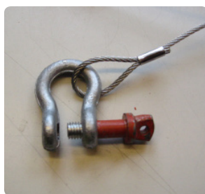
Detaljbild på Schackel