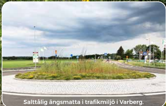
Salttålig ängsmatta i trafikmiljö i Varberg.